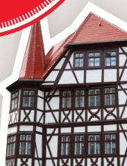
Gasometer am Holzplatz