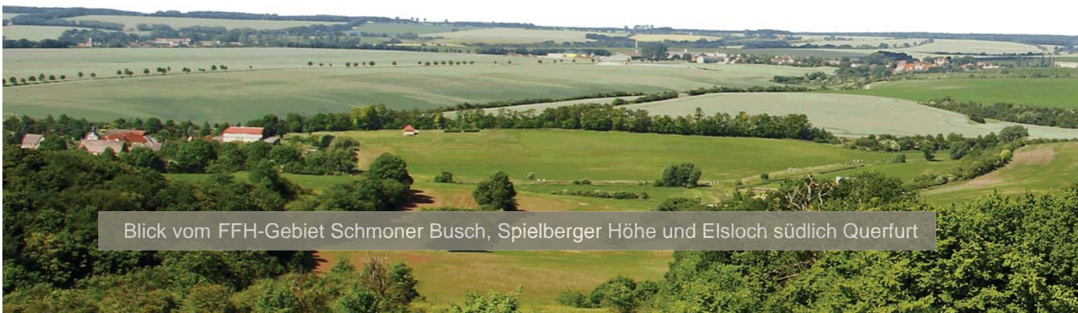
Blick vom FFH-Gebiet Schmoner Busch, Spielberger Höhe und Elsloch südlich Querfurt

Auf der NATURA 2000-Internetseite des Landesverwaltungsamtes www.natura2000-lsa.de gibt es eine interaktive Karte und weiterführende Informationen zu allen NATURA 2000-Gebieten in Sachsen-Anhalt.