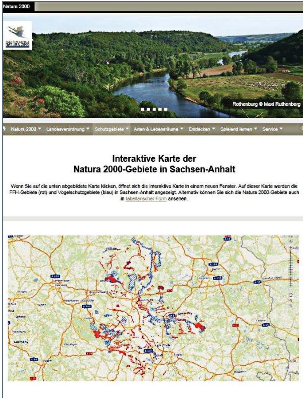
Ausschnitt der NATURA 2000-Internetseite des Landesverwaltungsamtes