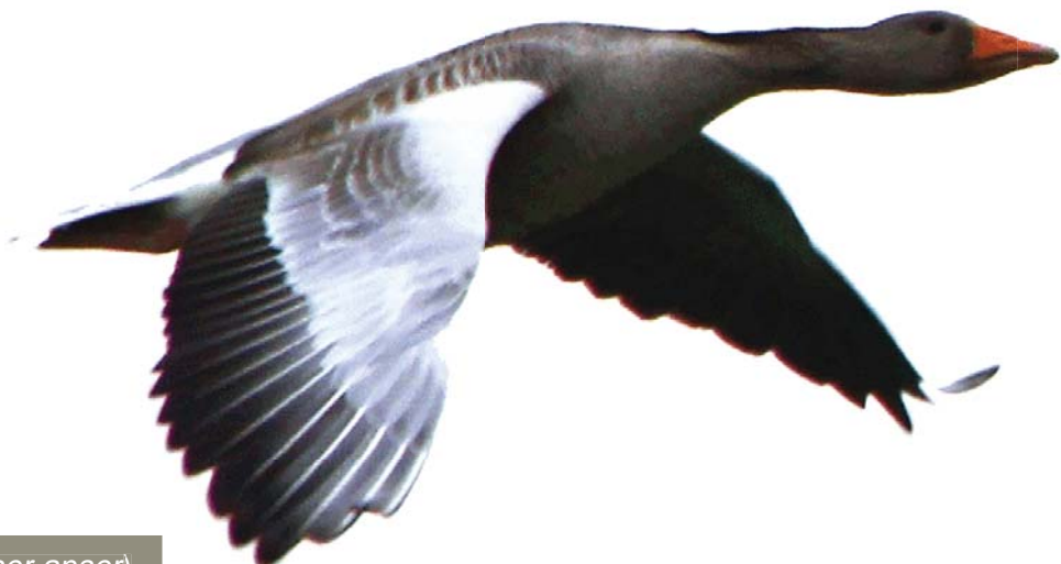
Graugans ( Anser anser )

Zum Schutzgegenstand gehören alle NATURA 2000-Gebiete, die durch die Landesverordnung als besondere Schutzgebiete festgesetzt werden. Lage und Abgrenzung der Gebiete sind sowohl auf Übersichts- als auch auf detaillierten Karten in verschiedenen Maßstäben dargestellt. Der für alle Gebiete gültige, übergeordnete Schutzzweck ist die Erhaltung und ggf. Wiederherstellung eines günstigen Erhaltungszustandes der aufgelisteten Lebensräume und Arten. Um diesen Schutzzweck zu erfüllen, werden Schutzbestimmungen festgelegt. Diese regeln für die verschiedenen Nutzergruppen, welche Handlungen in den NATURA 2000-Gebieten zulässig oder unzulässig sind. Unzulässig sind die Handlungen, die sich ungünstig auf die Erhaltungszustände der Lebensraumtypen oder Arten auswirken können und damit dem Schutzzweck zuwiderlaufen. In den Schlussvorschriften sind z. B. Freistellungen beinhaltet oder Handlungen definiert, für die Genehmigungen einzuholen sind.